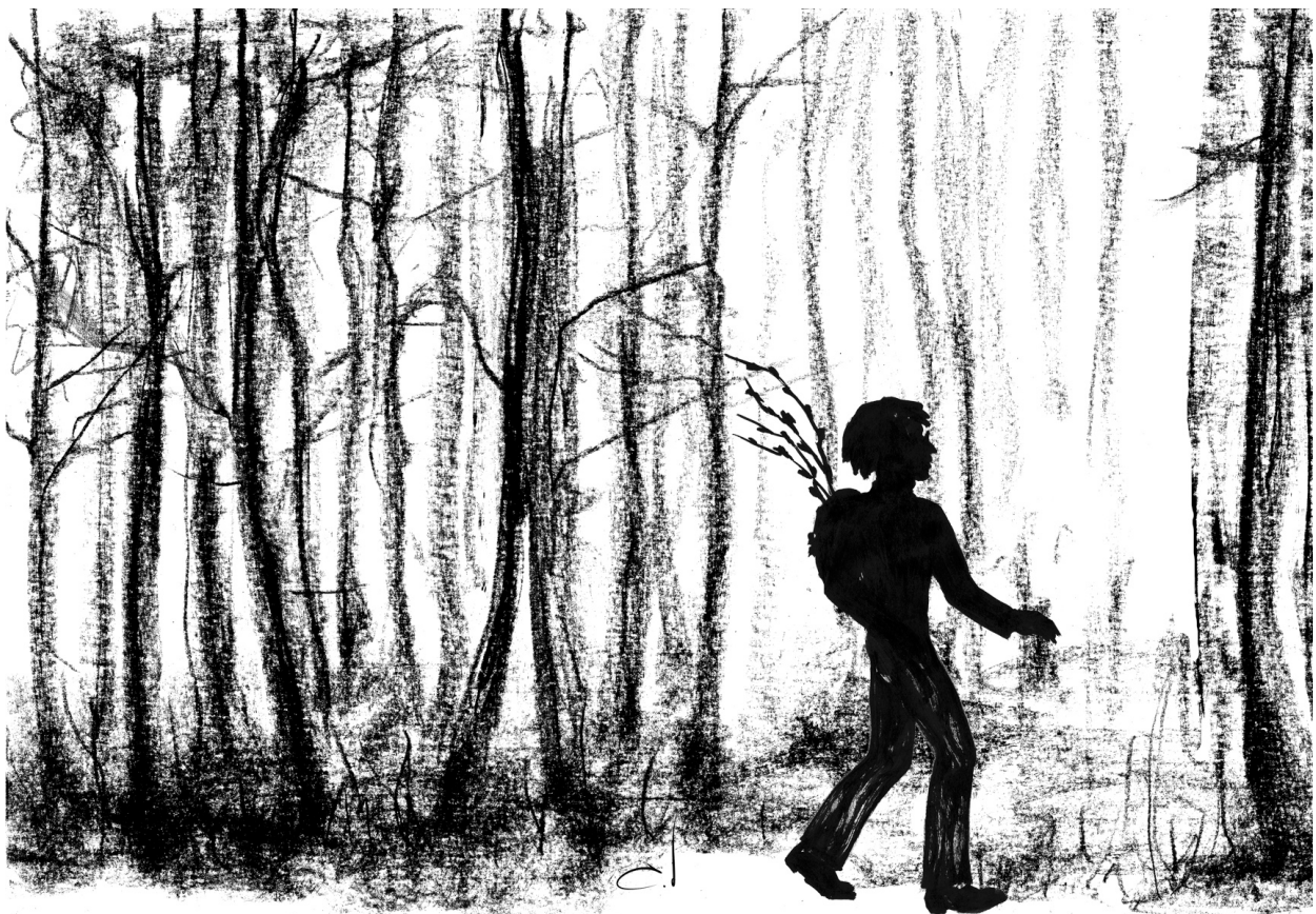
Иллюстрация Лилии Гойзман www.lilia-art.com

Красные огни семафоров мигали в отдалении. В тупике замер ржавый вагон. Прозвучал протяжный гудок локомотива. На повороте заскрипели рельсы. Они прошли закалку в литейных цехах ушедшей эпохи.