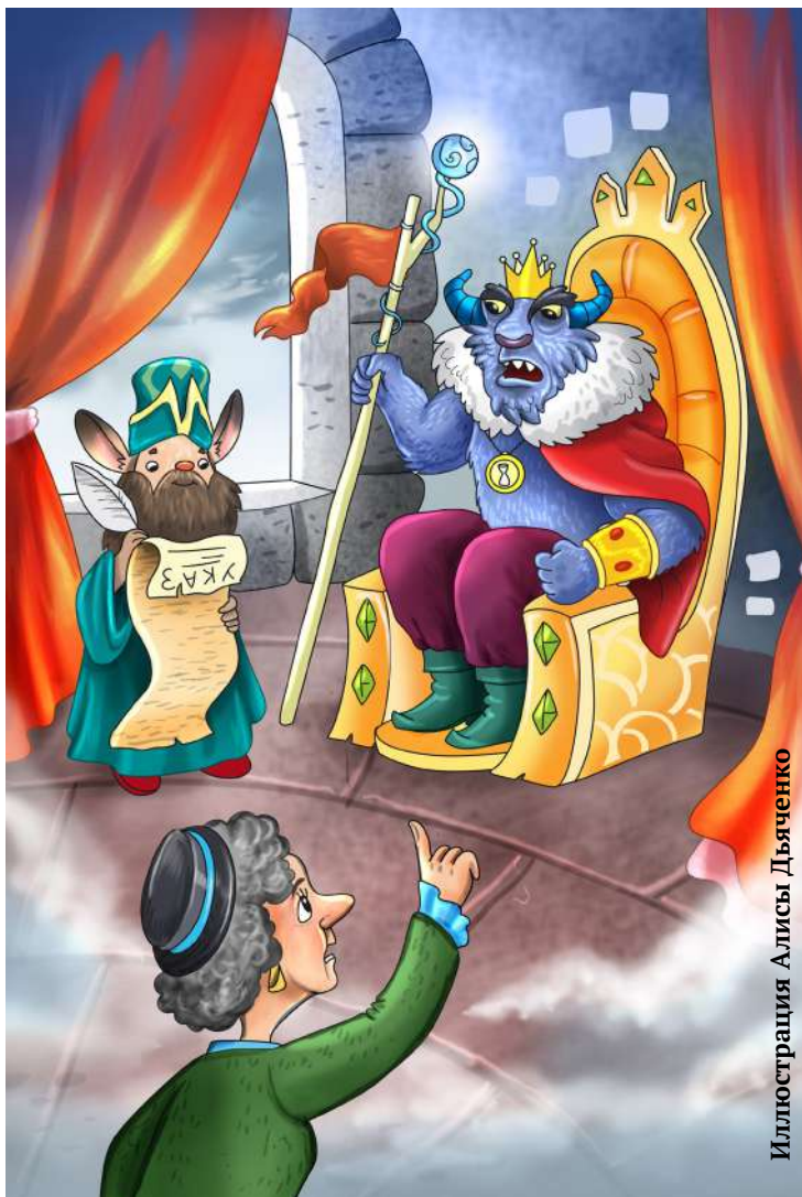
Иллюстрация Алисы Дьяченко

И промолвила: «Мой друг, Мы с тобой не держим слуг! Сам возьми, не зря даётся Человеку пара рук!»